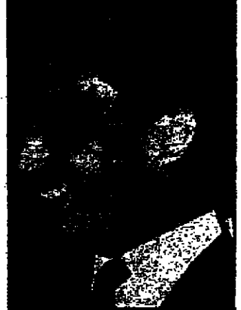
السيد روحى الخطيب أمين القدس يحيط به رجال الصحافة خلال مؤتمره الصحفي